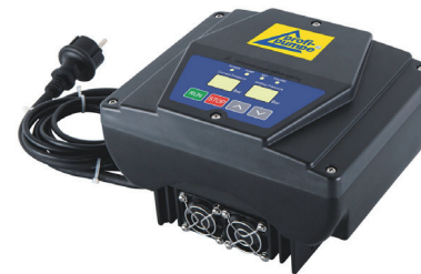
Air cooled / Luftgekühlt