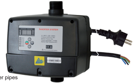
Water cooled / Wassergekühlt