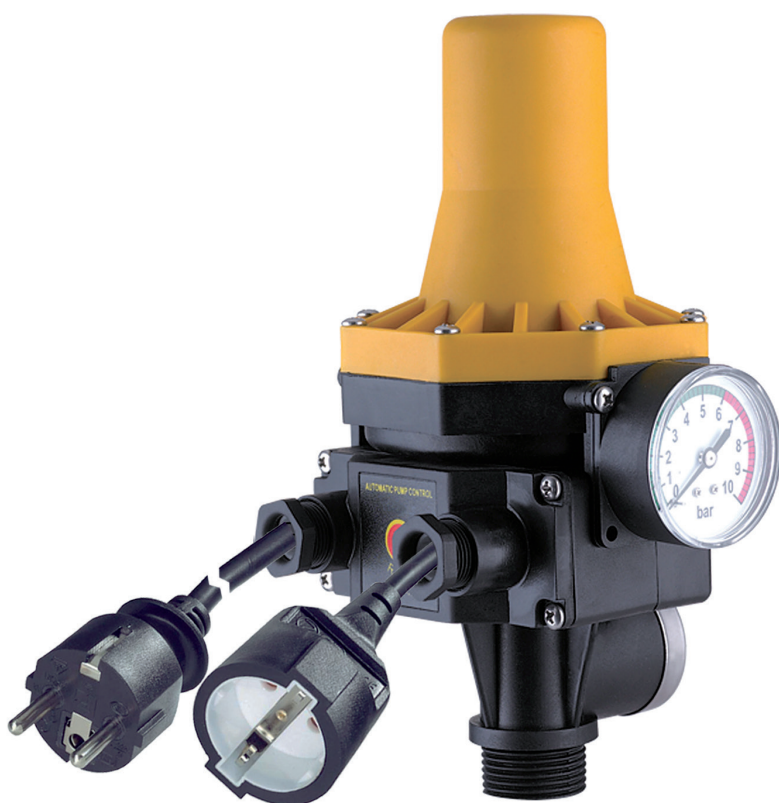
1. DURCHFLUSSWÄCHTER 3.2 AUTOMATIC-CONTROLLER VERKABELT (PSM01120V)