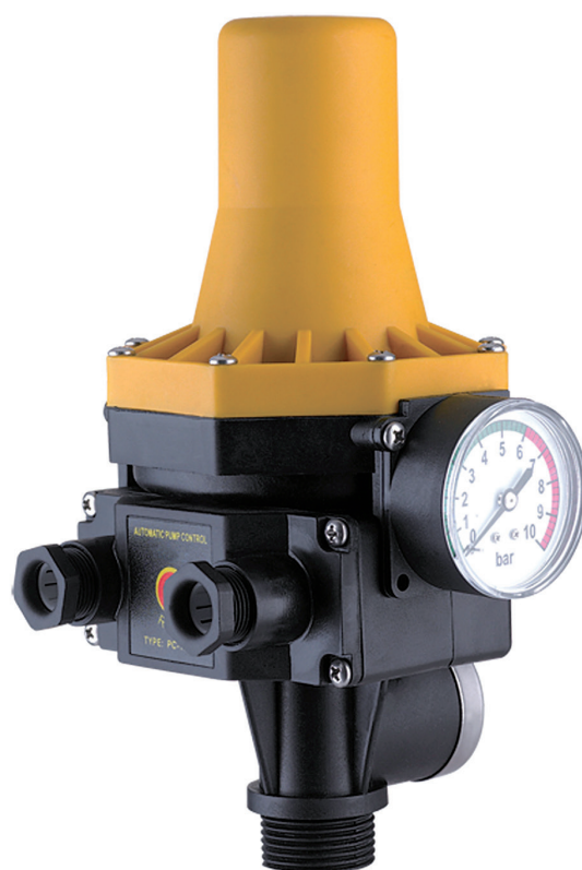
2. DURCHFLUSSWÄCHTER 3.2 AUTOMATIC-CONTROLLER UNVERKABELT (PSM01119U)