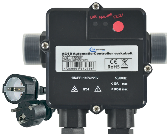
AC10, AUTOMATIC-CONTROLLER, VERKABELT (1A-AZ-DUK)