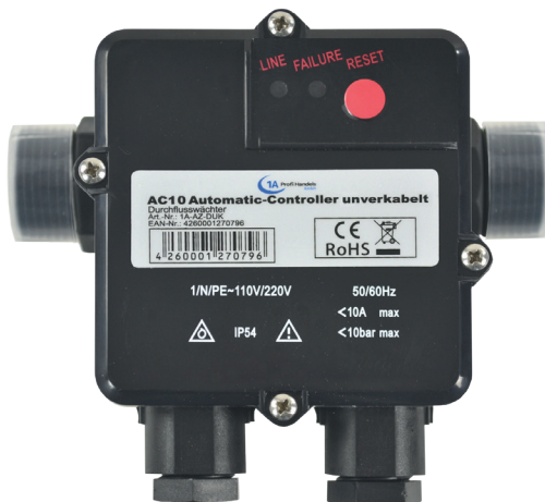
AC10, AUTOMATIC-CONTROLLER, UNVERKABELT (1A-AZ-DU)