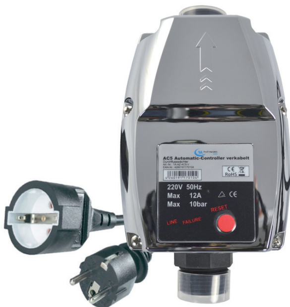
1. AC5 AUTOMATIC-CONTROLLER VERKABELT (1A-AZ-AC5-V)