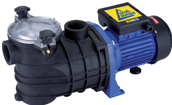
Schwimmbadpumpe POOL-STAR 370W (PO01109)