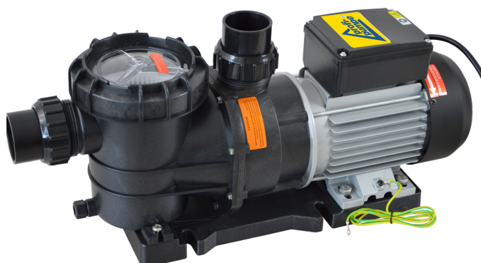
Schwimmbadpumpe POOL-STAR 1100-1 (PO01115)