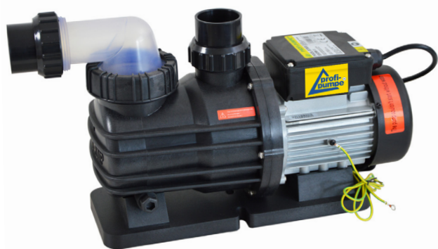
Schwimmbadpumpe POOL-STAR 550-1 (PO01113)